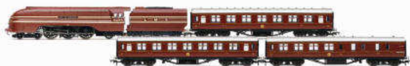
Hornby 'Days of Red & Gold' Train Pack